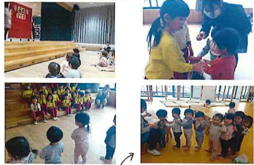
検温中、並んで待てるようになりました。